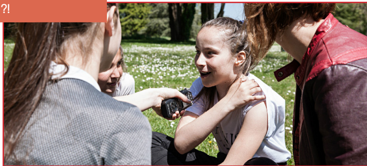
Une jeune habitante du quartier interviewée par « OSLF?! »

Justement, au mois de juillet dernier, une quinzaine de jeunes filles se sont retrouvées au local sur une semaine autour d'activités de coiffure, de maquillage et de papotage, un bon moment pour se retrouver et échanger entre filles (photographie, cartographie, sorties...).