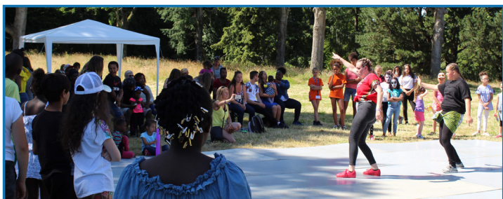
La représentation du groupe pendant la Fête de Quartier 2018

L'Afro est rythmée et très énergique alors que le Dance Hall est davantage basé sur l'ondulation du corps (la Wine). Le mélange des deux, ça donne beaucoup de rebond, un corps en mouvement et un déhanché de compète ! Mais surtout, ne jamais avoir les jambes tendues. Je leur dis toujours, je ne veux pas voir l'arrière de vos genoux !