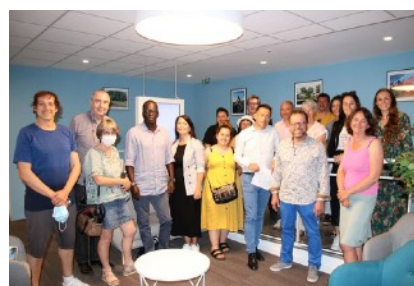
Les organisateurs et partenaires lors du lancement du concours le 21/06/2022