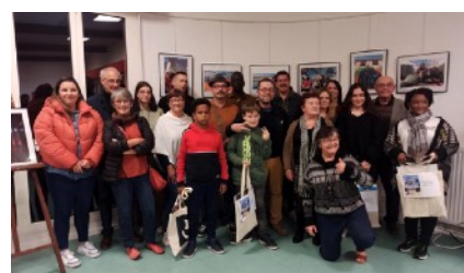
Les 12 Lauréats récompensés lors de la remise des prix