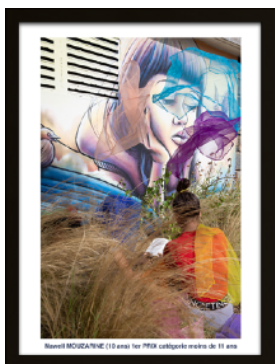
1er Prix - de 11 ans : Nawell MOUZARINE (10 ans)

Participants du 21/06 au 21/09/22 : 133 personnes