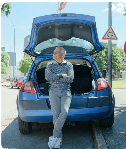
LAURENT - BREIZH COURSES 56

L'an dernier, j'ai travaillé pendant deux mois comme shopper pour une entreprise appelée « Hyper », qui proposait un service de livraison à domicile pour des personnes en situation de handicap. Cette expérience, très enrichissante, m'a donné envie de poursuivre dans cette voie.