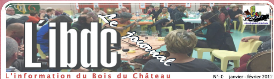
L'information du Bois du Château N°: 0 janvier - février 2017